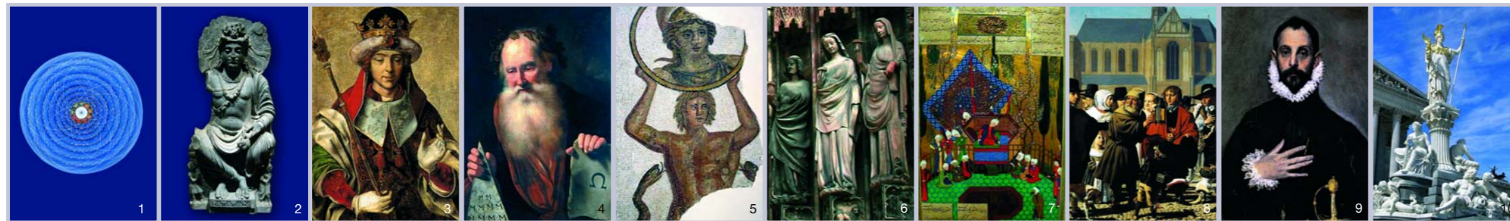
Kosmos-Mandala Uranfängliche Weisheit

Für die UN-Dekade »Bildung für eine nachhaltige Entwicklung« erarbeitet die Stiftung ein Projekt, das die verschiedenen Aspekte von Weisheit als Gestaltungskompetenz in die Bildungsdiskussion einführen wird.